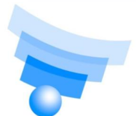
Servicio de Radioterapia UDELAR - Uruguay