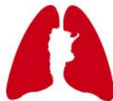
ASOCIACION ARGENTINA DE MEDICINA RESPIRATORIA