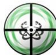
SOCIEDAD URUGUAYA DE RADIOTERAPIA CLÍNICA ONCOLÓGICA